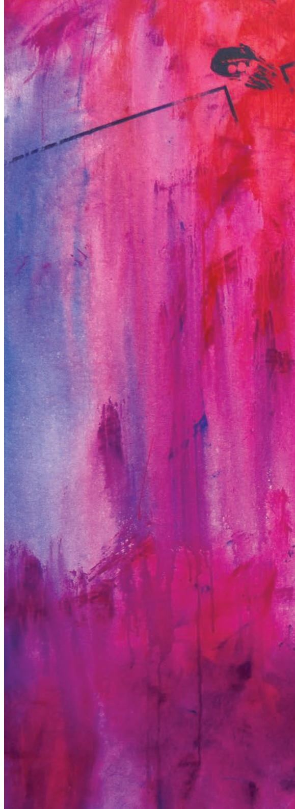
LA NOCHE AUSTRALIANA Acrílico. 200 × 200 cm