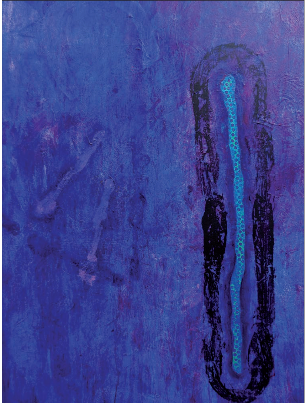
TRATADO DE BOTÁNICA 2 Acrílico sobre lienzo