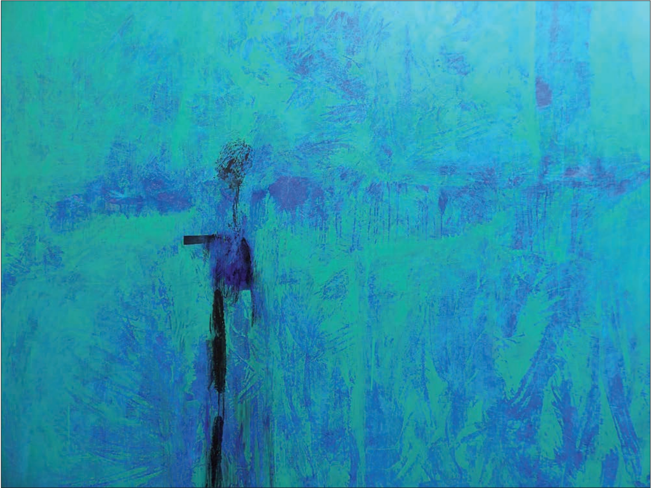
TRATADO DE BOTÁNICA