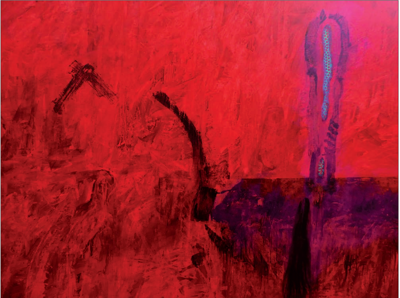
ABSTRACCIÓN N.º 6