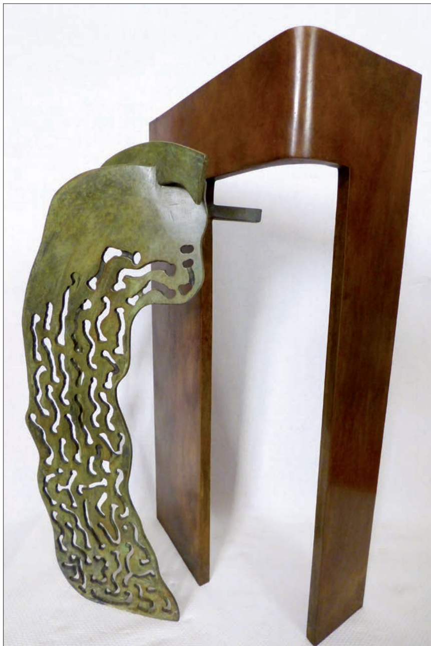
ARQUITECTURAS PARA EL AGUA Bronce y acero. 40 × 30 × 24 cm