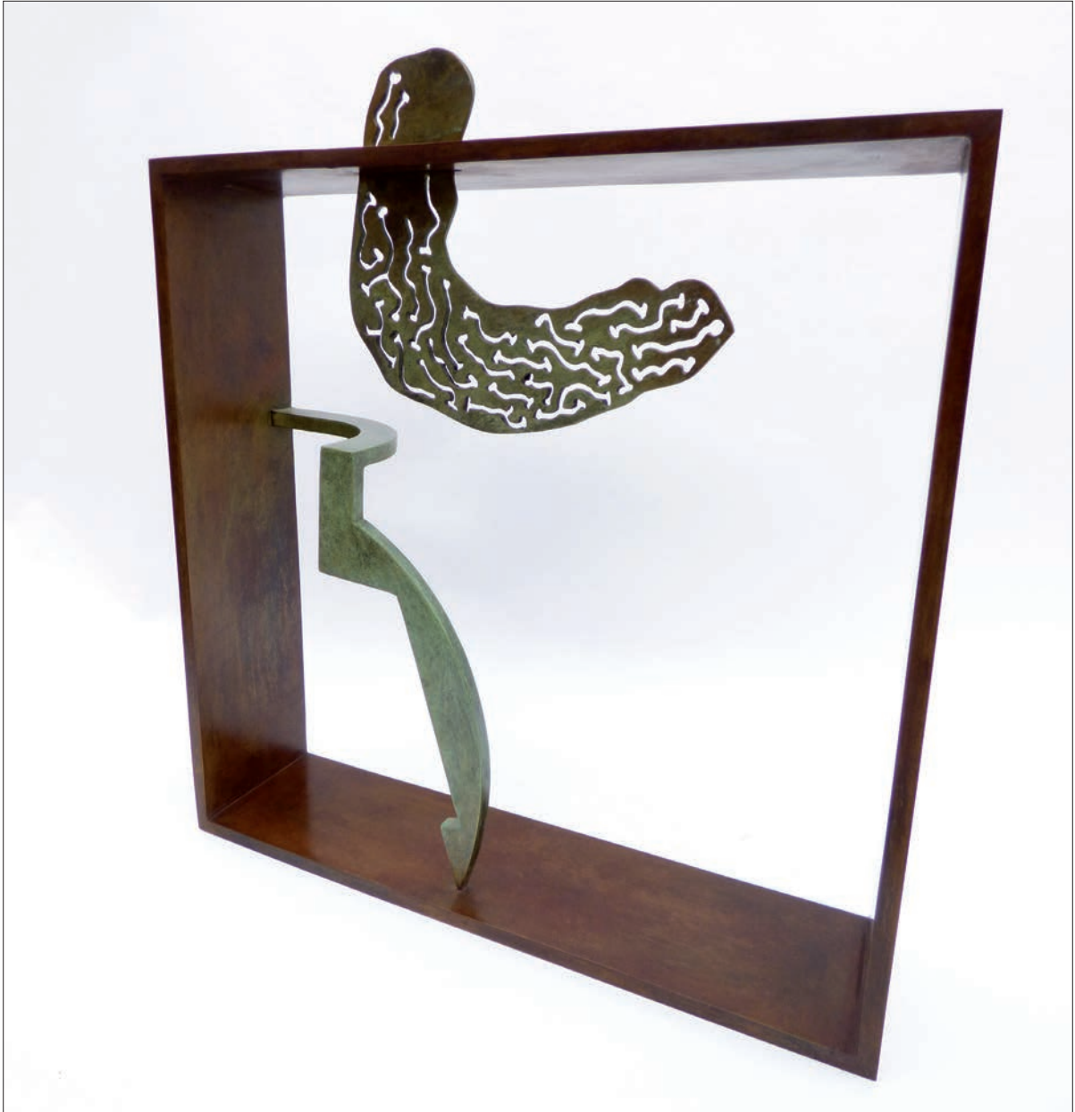
ARQUITECTURAS PARA EL AGUA