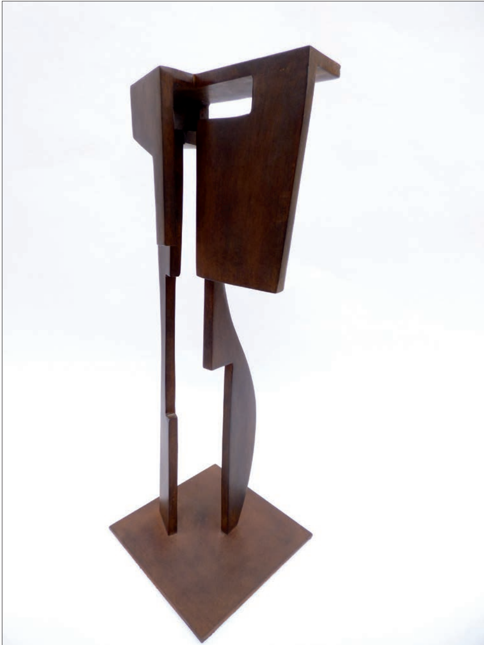
MYTHODEA 2 Acero. 41 × 15 × 15 cm