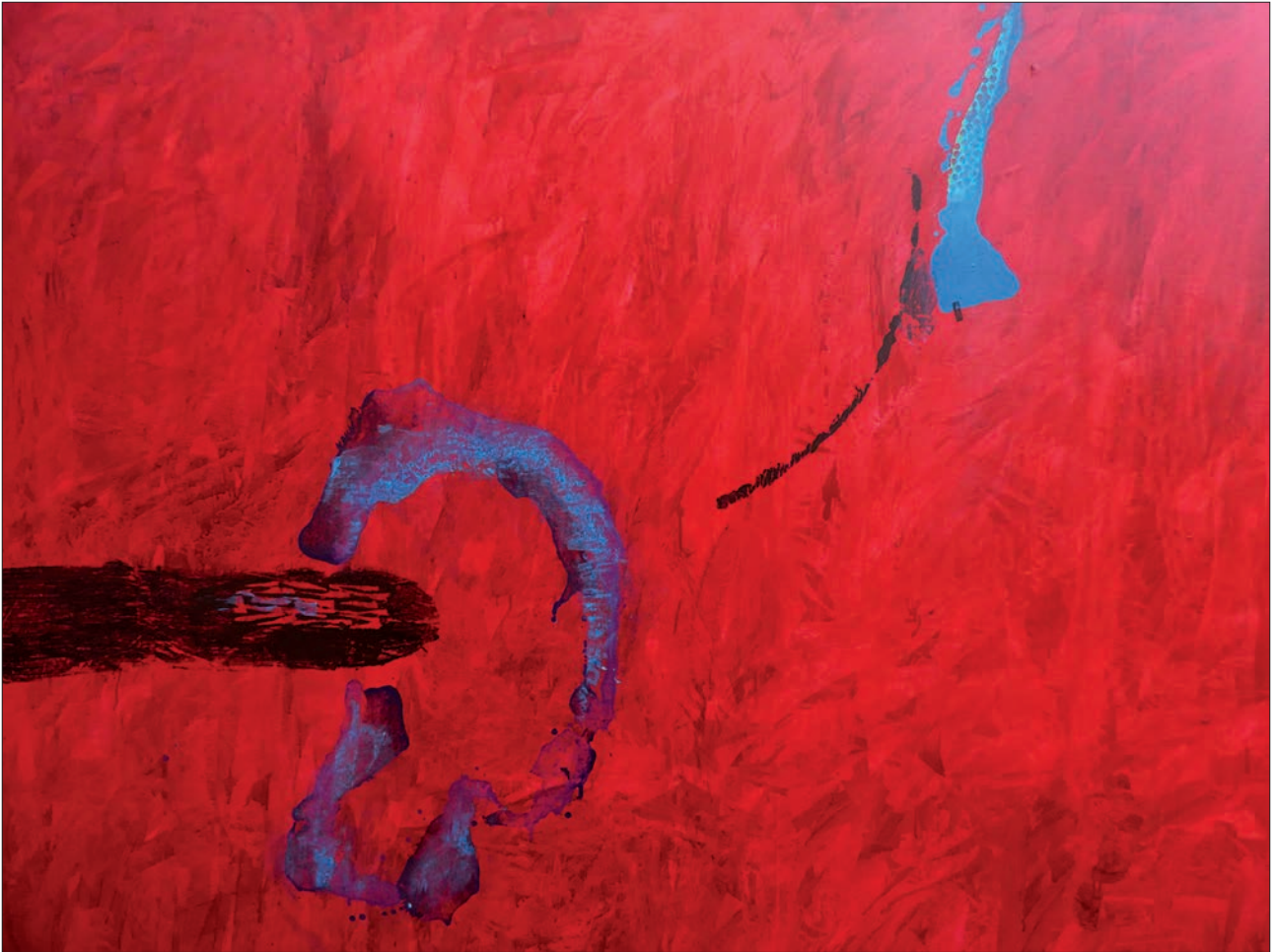
ABSTRACCIÓN N.º 5